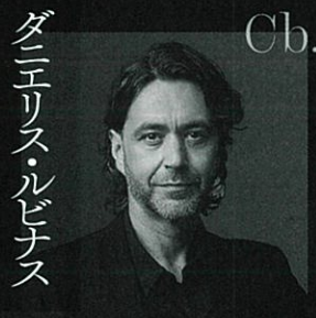
ダニリス・ルビナス